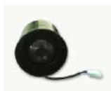
SIREN LOCK IN VERSIONE SEMPLIFICATA

In alternativa può essere montato il solo dispositivo siren lock in forma semplificata. In questa configurazione lo schedino irda sense e la serratura elettronica non vengono montate e l'attivazione/disattivazione dell'allarme avviene esclusivamente tramite apposite chiavette poste all'interno e all'esterno del mobile.